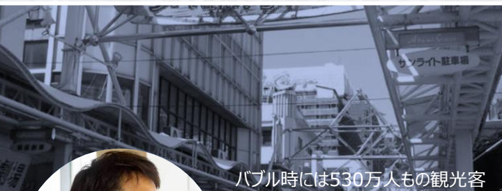
バブル時には530万人もの観光客